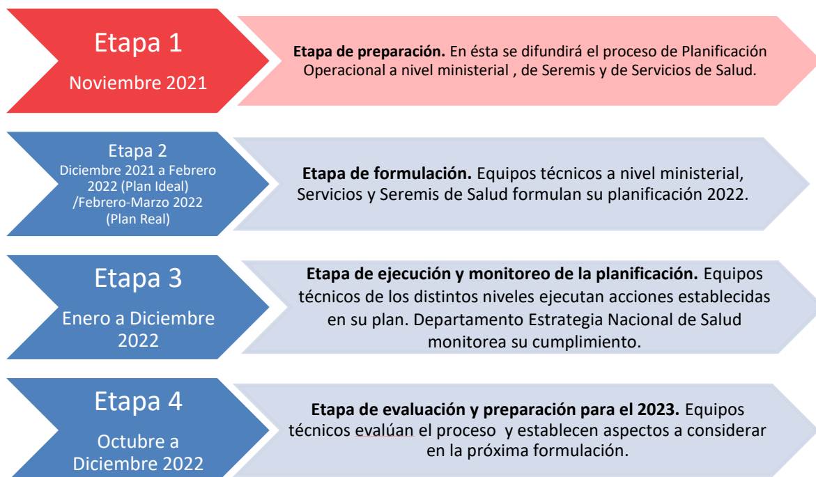
Figura 2. Etapas del proceso de Planificación Operativa 2022.

A continuación, se describen las etapas del Proceso de Planificación Operativa.